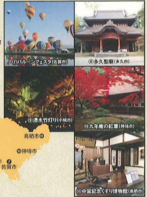
⑦バルーンフェスタ(佐賀市)