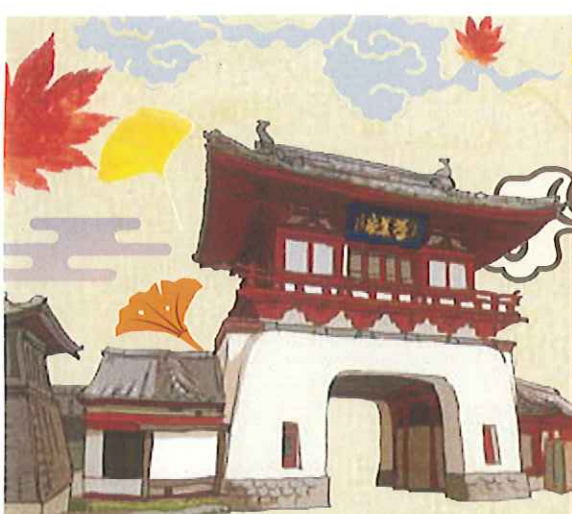
武雄温泉 「楼門」(武雄市)

東京駅や日本銀行を設計した辰野金吾氏の設計により大正4年に竣工。国指定重要文化財。竜宮城を連想させる鮮やかな色彩と形で、天平式楼門と呼ばれ、釘を1本も使用していない建築物。