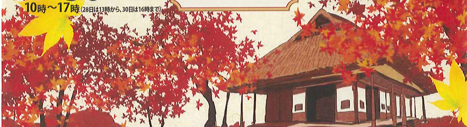
佐賀の大実業家、伊丹弥太郎が明治25年に造った別荘と明治33年から9年の歳月をかけて築いた6,800㎡の庭園。平成7年2月に国の名勝の指定を受け、毎年秋の紅葉の時と春の新緑の時に一般公開。

小城市は羊羹の名産地で、羊羹資料館は昭和16年に砂糖の貯蔵庫として建築された。現在は改装され、羊羹づくりの道具等が展示されている。