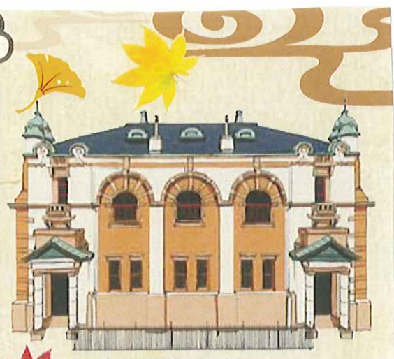
旧唐津銀行本店 (唐津市)

煉瓦造りの本建物は、唐津に繁栄をもたらした石炭産業を支えながら発展した唐津銀行の本店として、明治45年(1912年)に竣工。