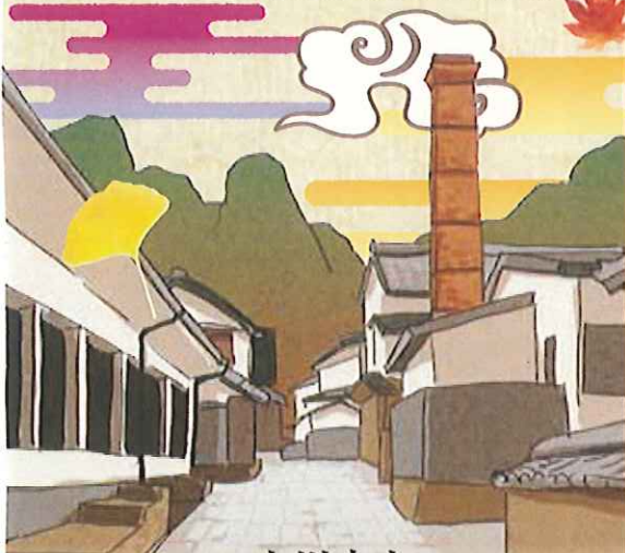
秘窯の里 大川内山 (伊万里市)

東京駅や日本銀行を設計した辰野金吾氏の設計により大正4年に竣工。国指定重要文化財。竜宮城を連想させる鮮やかな色彩と形で、天平式楼門と呼ばれ、釘を1本も使用していない建築物。