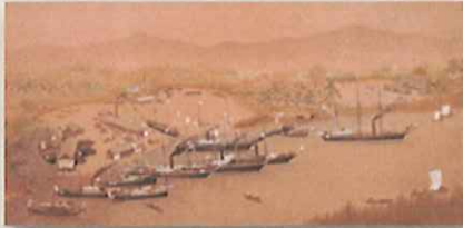
佐賀藩三重津海軍所絵図

「佐賀県遺産」とは佐賀県の「美しい景観を呈する地区」、「地域を象徴する建造物」のことです。次の世代、22世紀に残していきたいという県民の思いが詰まった、その宝物たちをどうぞご覧ください。