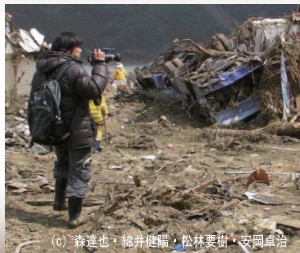
(c) 森達也・綿井健陽・松林要樹・安岡卓治

森監督はこの映画のテーマに「後ろめたさ」があるという。被災地で、平穏無事な自分が被災者にカメラを向ける。彼らは死んだのに自分は生きている。この後ろめたさを直視することで、人間は他者に対して無関心で冷酷であることに気づかされるという。森監督、綿井監督によるトークを交え、震災を通して見えてくる人間の姿を見つめる。