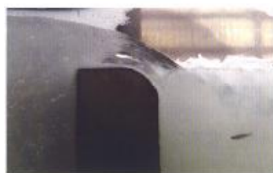
魚道の流れと魚の遡上の様子を 実際の現場のスケールで映像で 表示しています