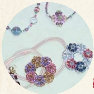
アクセサリ(福島県)