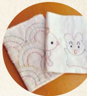
刺し子台ふき(福島県)