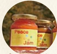
野菜ジャム(宮城県)