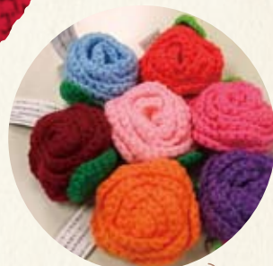
気仙沼のバラ(宮城県)