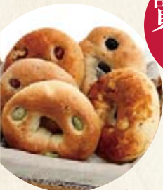
ペーグルリン(岩手県)