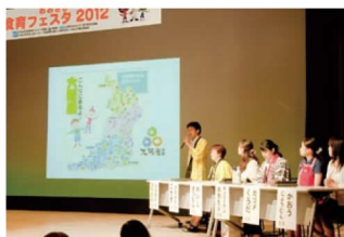
※写真は過去の実施風景より。