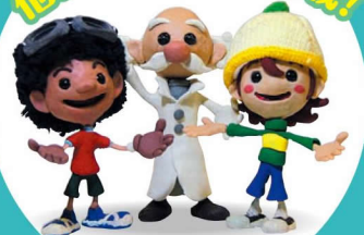
大阪府食育推進キャラクター