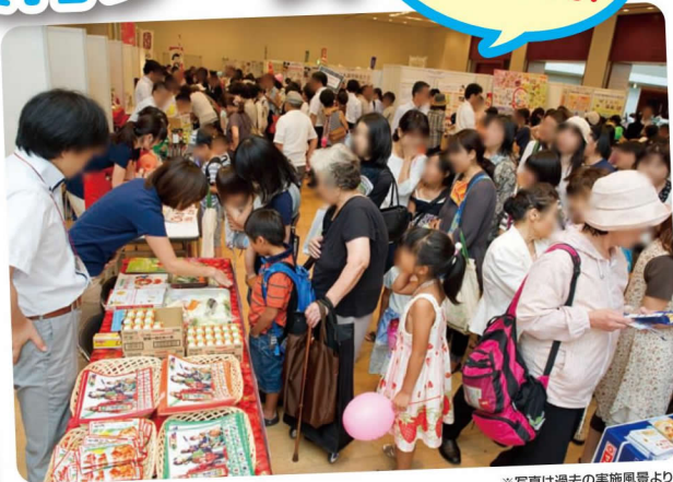
※写真は過去の実施風景より。

野菜、朝食、食の楽しさなどをテーマに、28団体がブースを出展。試食・サンプリングなども含め、食育を五感で体験できます。