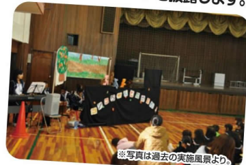
※写真は過去の実施風景より。

子どもや同世代の仲間に向け食育活動を行う食育ヤングリーダーが楽しく学べる食育ステージを披露します。