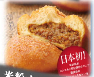
米粉カレー& 米粉パン