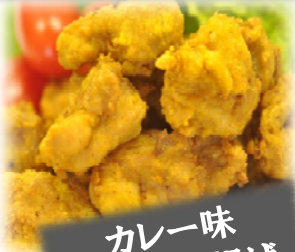
カレー味 米粉から揚げ