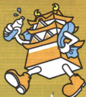
イメージキャラクター 「天守くん」 デザイン: 中井貴史(大阪芸術大学)