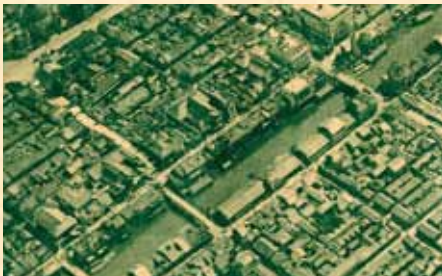
道頓堀の空撮。右上に松竹座と戎橋が見える。

阪の下町に生きる庶民の姿を、語るような文体で描いた大阪出身の作家、織田作之助。8月のラボカフェでは、「おださく」の愛称でも知られる織田作之助の生誕100周年を記念して、展示とトークサロンによる特別プログラムを実施します。おださくが見つけ、その作品のなかに生き生きと描き出された大阪をじっくりと味わう今回の「OSAKANA CAFE」。ぜひご参加ください。