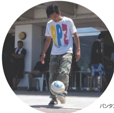
バンタンデザイン研究所