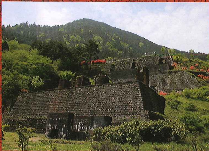
東洋のマチュピチュといわれる 東平選鉱場・貯鉱庫・索道停車場跡