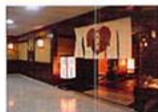
美濃吉 心齋橋御堂筋店

京懐石美濃吉は京都で最も古く、かつ由緒ある料亭です。 起源は享保元年。290余年の永きにわたり伝承の川魚料理と季節の 京料理をご堪能いただけます。 昭和四十四年には京都府知事より表彰、また五十八年には第五回食 品産業優良企業表彰にて外食産業部門として農林水産大臣賞を受賞 されております。 現在でもなお、伝統の「京料理」を革新し続けられております。