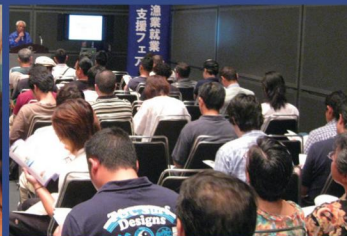
●ガイダンスコーナー