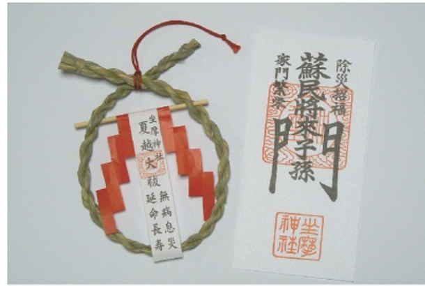
茅の輪お守り・蘇民将来子孫門の御札

当社では氏子崇敬者各位の心身の更なる浄化を神に祈る夏越の大祓を毎年六月三十日に斎行いたしております。大祓に参加希望の方は「人形」に所定の作法をお執り行いのうえ、お志しの初穂料を添えてお申し込み下さい。大祓をお申込み頂きました方には、ご参加のおしるしとして師走には「蘇民将来子孫門の御札」を、夏越には「茅の輪お守り」をお頒ちいたします。それぞれお頒かちしてから一年間玄関や玄関軒下等に並べてお祀り頂きますようお願い申し上げます。