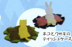
ネコとウサギの ティッシュケース