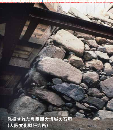
発掘された豊臣期大坂城の石垣 (大阪文化財研究所)