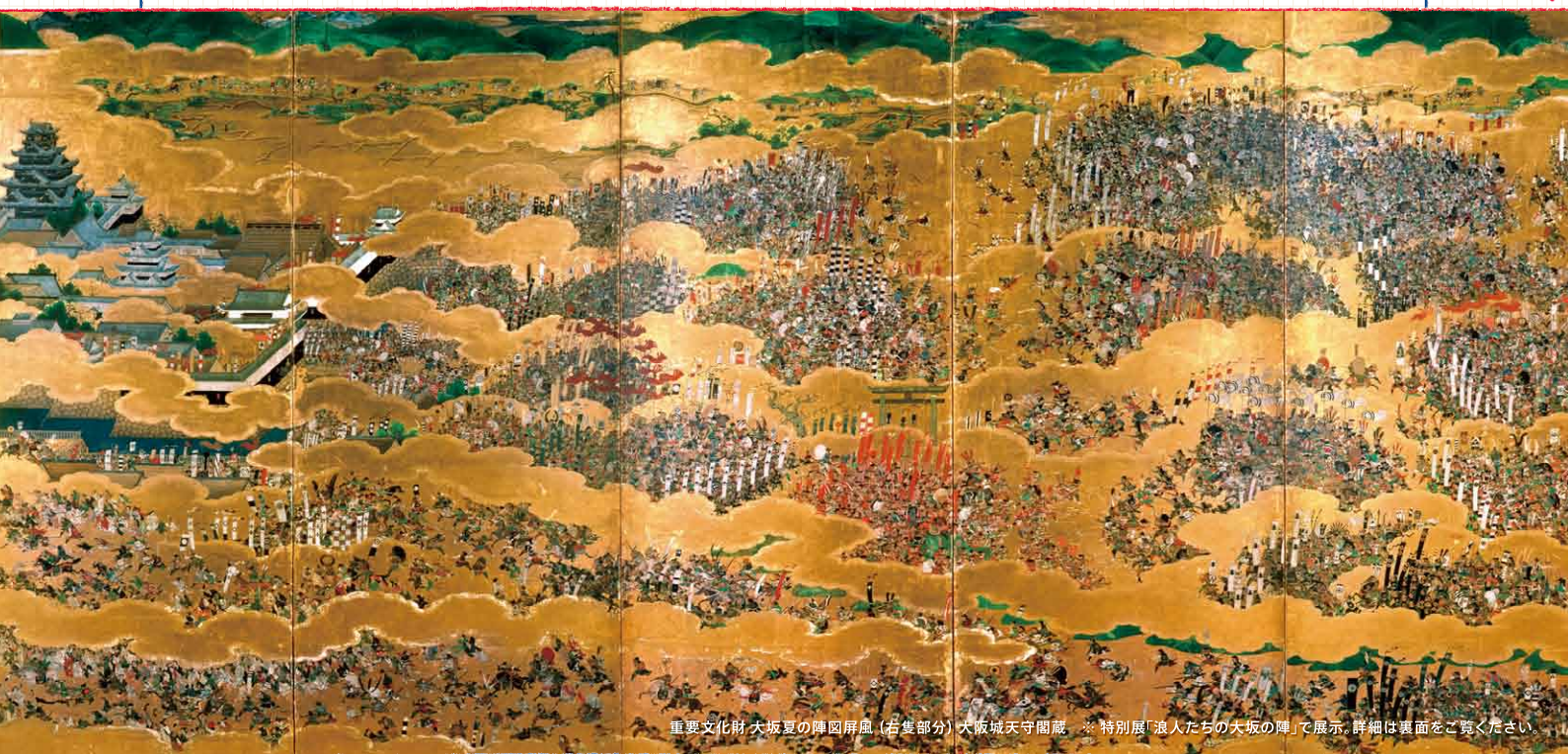
重要文化財 大坂夏の陣図屏風(右隻部分) 大坂城天守閣蔵 ※特別展「浪人たちの大坂の陣」で展示。詳細は裏面をご覧ください。