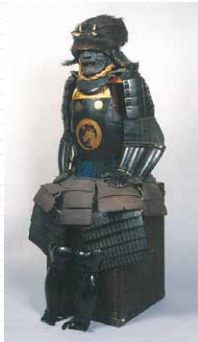
日月龍文蒔絵仏胴具足 (後藤又兵衛所用)

※入館は閉館の30分前まで ※なお会期中、秋のイベント等にあわせて開館延長することがあります