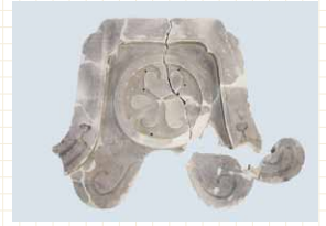
大坂城本丸で見つかった 三葉葵紋鬼瓦

平成25年度に大阪文化財研究所が行った大阪市内の発掘調査のうち、江戸時代の大坂城本丸の屋根を飾った鬼瓦など、主要な成果を約170点の出土資料と写真パネルでご紹介します。