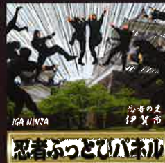
IGA NINJA 伊賀市