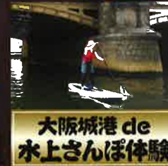
大阪城港 de 水上さんぽ体験