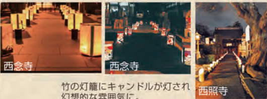
竹の灯籠にキャンドルが灯され幻想的な雰囲気。 西照寺

お寺の皆さまのご協力により、門前や境内などにキャンドルライトが並びます。また、行灯を灯していただくお寺や、本堂にあかりを灯していただくお寺など、前回のイベント時にも大変好評でした。