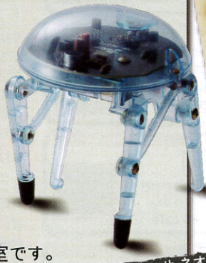
メデューサ・ネオ

17日はロボット「メデューサ・ネオ」を、18日は「ロボットアーム」を工作し、作った作品はお持ち帰りできます。作り方は指導員がお教えます。