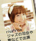
risa*risa ジャズの司会や歌などで出演

「ものづくり」にちなんだ楽曲と究極の技(名演奏)を選曲して、お聴かせします。クラシックになじみのない方にも楽しい講演会です。 ※各特設会場の場所はウラ面の地図を、ご参照ください。