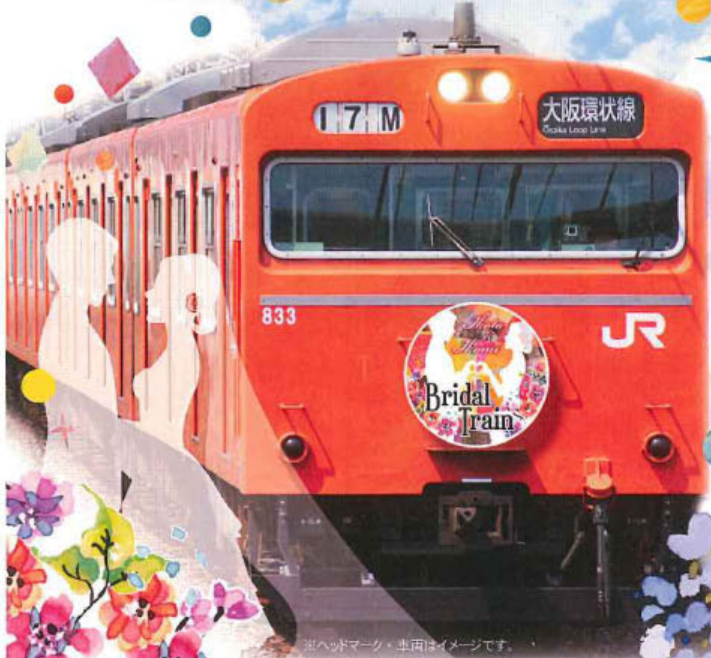
※ヘッドマーク・車両はイメージです。