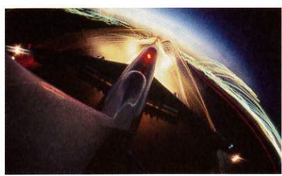
2 《入念な準備とチームワーク》 ブルース・デール