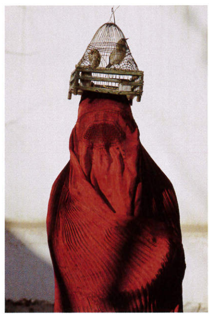
4 《かごの中の鳥》 トマス・J・アバークロンビー