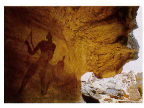
5 《等身大の射手》 野町和嘉

米国ナショナル ジオグラフィック誌の紙面を飾った数少ない日本人写真家の中から、野町和嘉、岩合光昭両氏の作品を特別展示いたします。日本を代表する写真家である両氏の世界各国で称賛された傑作をぜひご堪能ください。