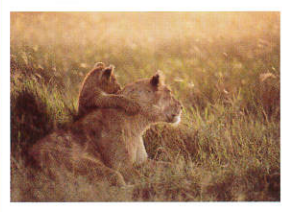
6 《親子のぎずな》 岩合光昭