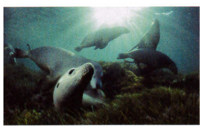
3 《アシカの楽園》 デビッド・デュビレ