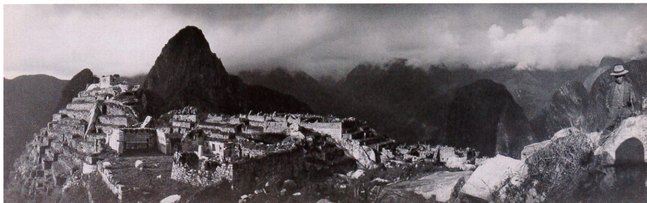
1 《伝説の都市、マチュピチュ》 ハイラム・ビンガム