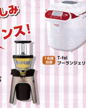
1名様 当選 T-fal フーランジェリー