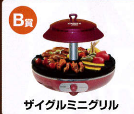
B賞 ザイグルミニグリル