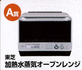
A賞 東芝 加熱水蒸気オーブンレンジ