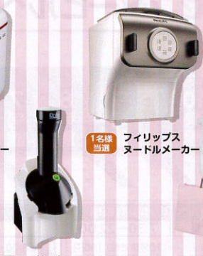
1名様 当選 フィリップス ノードルメーカー