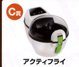
C賞 アクティブフライ

当日、各エレベーターホール前にお応募用紙に必要事項をご記入の上、応募ボックスにお入れください。抽選で上記賞品が当たります。※当選発表は7月31日(金)、HP上にて。(応募はお一人様一日1回)