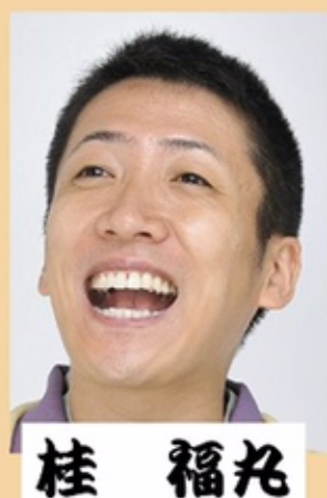
桂 福丸 〈落語〉