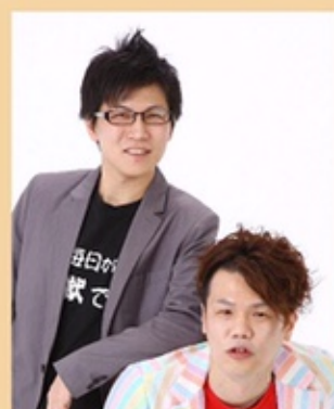
地獄の遺伝子 〈漫才〉

DNA池上、ヘル東内からなる漫才コンビ。過激なコンビ名とは裏腹に、ソフトな笑顔とさわやかなキャラでファンも多い。なんば白鯨などで活躍中。