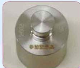
分銅(200g・50名)