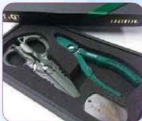
GTパック(10名) 提供: 株式会社エニシア

参加者の中から抽選で、GTパックを10名様、 血圧計を5名様、分銅(200g・50名様)をプレゼント