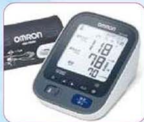
血圧計(5名) 提供: オムロンヘルスケア株式会社