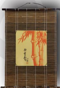
簾のみの販売となります。色紙は含まれません。