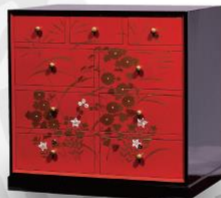
大阪泉州桐筆奇 伝