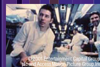
『ディナーラッシュ』 デジタル・リマスター版