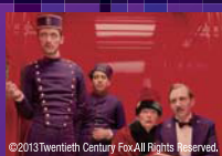
『グランド・ブダペスト・ホテル』