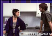
『朝食、昼食、そして夕食』