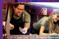
『シェフ ～ミツ星フードトラック始めました～』