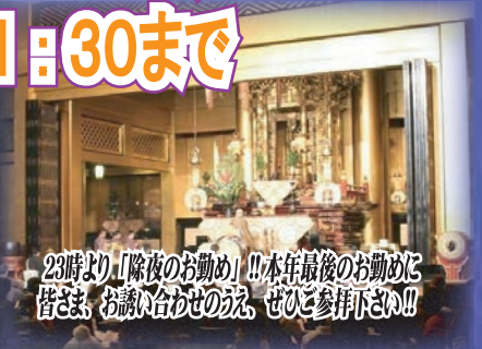
23時より「除夜のお勤め」!! 本年最後の勤めに 皆さま、お誘い合わせのえ、ぜひと参拝下さい!!