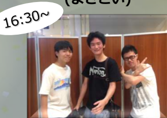
16:30~ NONAMEroc (バンド)