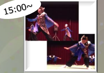
15:00~ よさこいソーランチーム 彩玻-いろは- (よさこい)