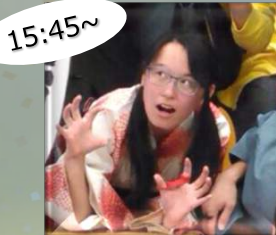
15:45~ 蚊鳴家らんぼ (落語)