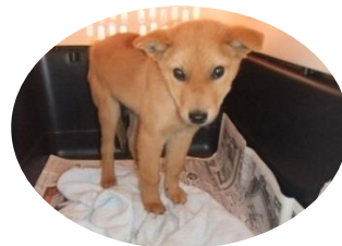
ゆめのすけ 保護時の夢之丞