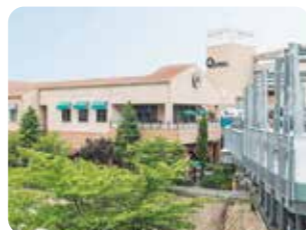
みのおキューズモール 大阪府箕面市西宿1丁目17番22号