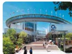
もりのみやキューズモールBASE 大阪市中央区森ノ宮中央2丁目1番70号