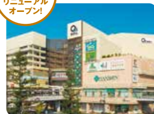
あまがさきキューズモール 兵庫県尼崎市潮江1丁目3番1号