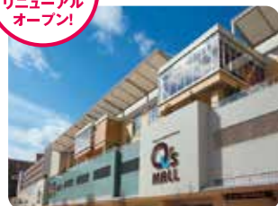
あべのキューズモール 大阪市阿倍野区阿倍野筋1丁目6番1号