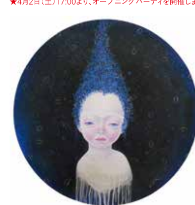
こうぶんこうぞう《幻に咲いたうそ...》 アクリル・キャンバス 直径60cm 2015年

4月2日(土)―4月17日(日) ◎会期中無休 ※通常は月・火曜日休廊 平日11:00-19:00 土曜日11:00-19:00 日曜日11:00-17:00 ★4月2日(土)17:00より、オープニングパーティを開催します。