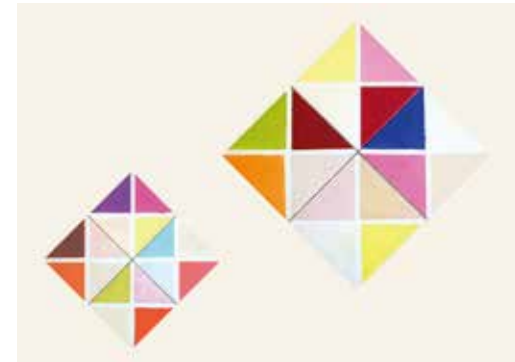
左:北野明「パリオ」 キャンバスに油彩・パステル 51×51cm 2015年 右:北野明「幸福を呼ぶ扉」 キャンバスに油彩・パステル 64×64cm 2015年

今年90歳を迎えた北野明の画業の集大成。2006年より毎年回を重ねて、今年にはキャンバスに油彩・パステルを用いた新作「薄化粧する春」「薔薇のロザリオ」「6月の花嫁」「海のような伽藍」etc...40数点を発表します。