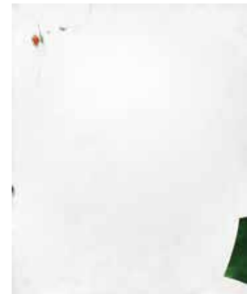
《じゃわり、抜ける》 アクリル・水彩・クレヨン・樹脂粘土・綿布・パネル 162×130cm 2015年

4月4日(月)―4月12日(火) ◎会期中無休 ※通常は日・祝日休廊 平日11:00-18:00 土曜日11:00-17:00 日曜日11:00-17:00