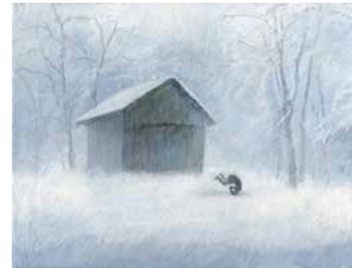
高橋舞子《ハシバミ》 キャンバスに油彩 33.5×24.0cm 2016年

常緑樹の林の合間に見える、あの、葉を落とした一本の針葉樹を、私は知っている。日時を記録して、学名を覚えておいた、あの樹が自分のものだ、あの樹が自分なのだ。私は落葉松を知っている。