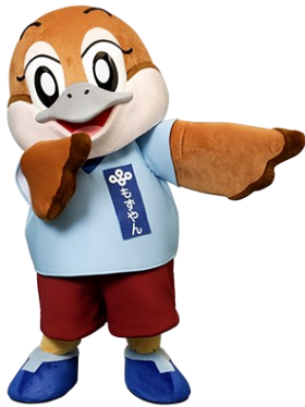
大阪府広報担当副知事 もずやん