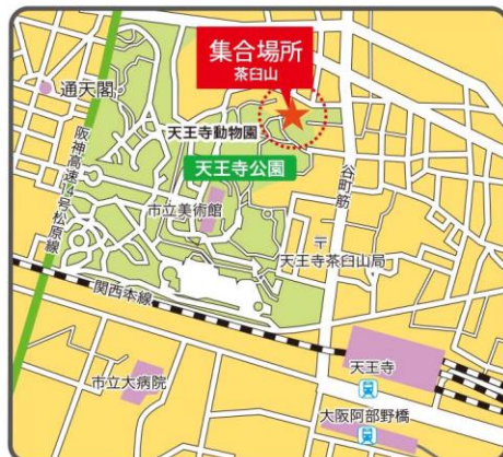
●JR「天王寺駅」 ●地下鉄谷町線・御堂筋線「天王寺駅」

《スタート》①茶白山▶②一心寺▶③安居神社▶④口縄坂▶⑤月江寺▶⑥増福寺▶⑦銀山寺▶⑧生國魂神社▶⑨からほり商店街：ガイド▶⑩鎌八幡(円珠庵)▶⑪善福寺▶⑫心眼寺：ガイド▶⑬興徳寺▶⑭真田丸顕彰碑(大阪明星学園)▶⑮大應寺▶⑯真田山公園▶⑰三光神社▶《ゴール》⑱玉造稻荷神社