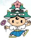
中央区マスコットキャラクター いちまるくん