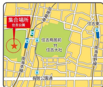
●南海本線「住吉大社駅」 ●阪堺軌道阪堺線「住吉鳥居前駅」

《スタート》①住吉公園▶②住吉大社▶③生根神社▶④万代池公園▶《ゴール》⑤長居公園