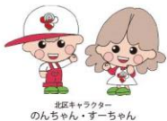
北区キャラクター のんちゃん・さーちゃん