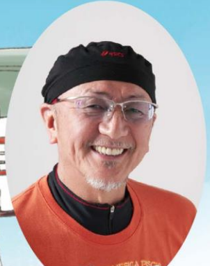
第1回スペシャルゲスト ●デューク更家さん●