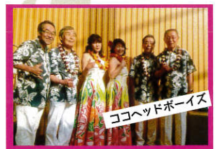
ココヘッドボーイズ