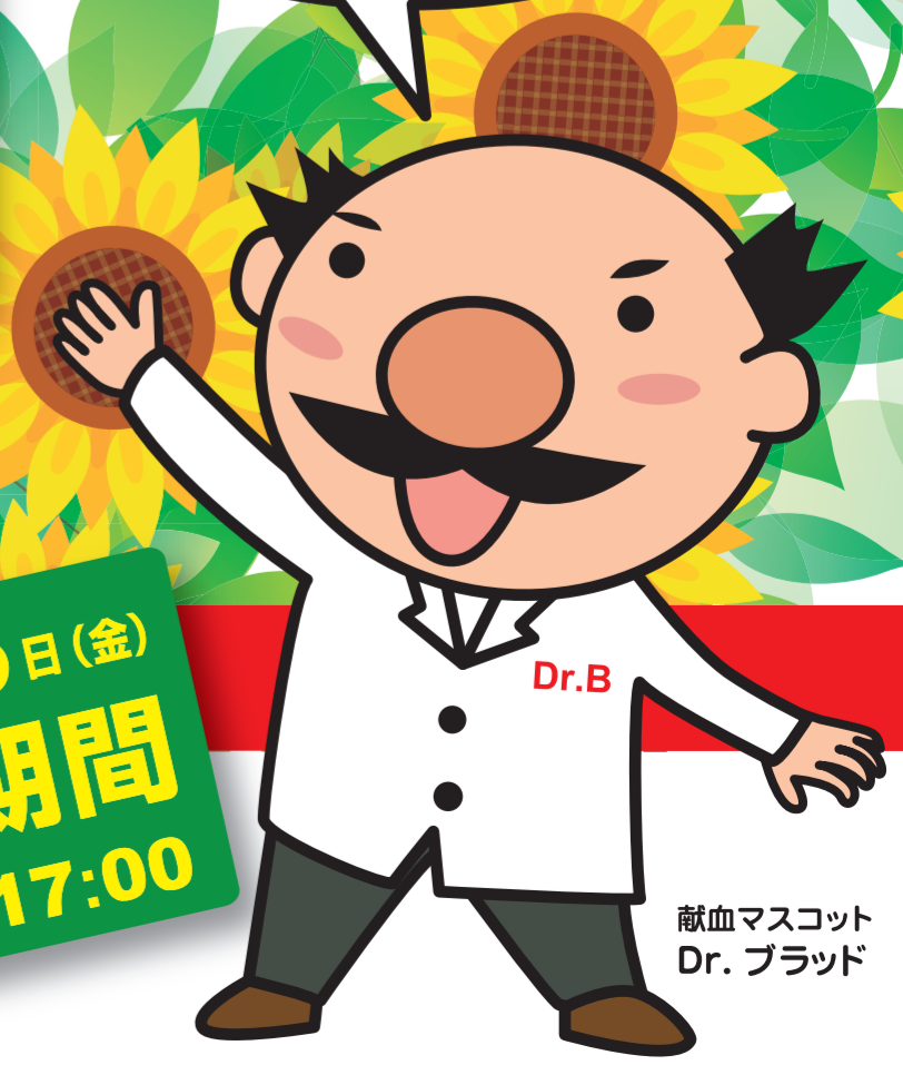
献血マスコット Dr. ブラッド