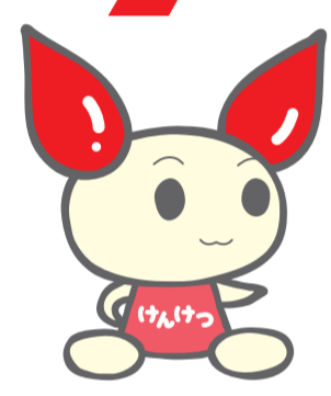
献血キャラクター けんけつちゃん