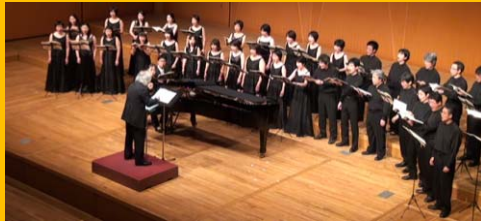
大阪ハイブリット・シュッツ室内合唱団

正庁の間で大阪ハイブリット・シュッツ室内合唱団の歌声をお聴きいただいたあとに、館内と地下の免震層を見学します。