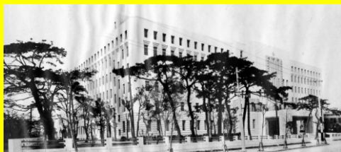
府庁本館の竣工写真

本館が建てられた大正時代の大阪について、府政を中心に府公文書館の所蔵資料で振り返る歴史講座のあとに、館内と地下の免震層を見学します。