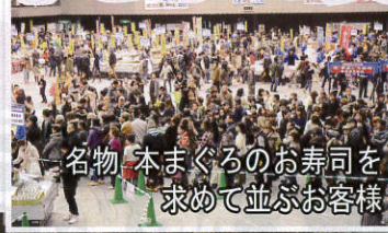
名物 本まぐろのお寿司を 求めて並ぶお客様