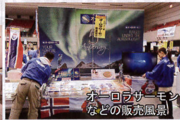
オーロラサーモン などの販売風景