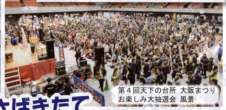
第4回天下の台所 大阪まつり お楽しみ大抽選会 風景