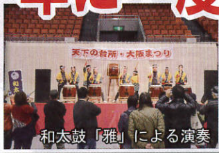
天下の台所・大阪まつり 和太鼓「雅」による演奏