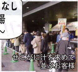
せこがに汁を求めて 並ぶお客様