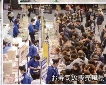
お寿司の販売風景