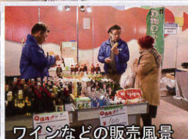
ワインなどの販売風景