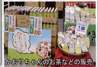
かおりちやんのお茶などの販売