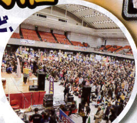
第4回天下の台所 大阪まつり お楽しみ大抽選会風景