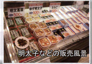
明太子などの販売風景