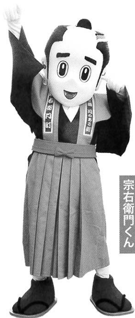
商店街キャラクター 宗右衛門くん

南地花街の風習「お化け」を現代風に引き継ぎながら、節分の日にご家庭での豆まきや恵方に向かって食べる「巻き寿司」と同じく、家内安全、厄除招福、商売繁盛などを願って、当日会場に来られた皆さんと共に、餅をつき、善哉やきなこ餅などにして振る舞います。南地花街の時代から続く伝統的風習「お化け化粧」の継承も、このイベントで行っており、「お化け化粧(仮装)」をしたスタッフが会場内に登場し、多くのお客様をお出迎えします。20年以上続く、小さいけれど意味ある当商店街の独自の伝統行事です。