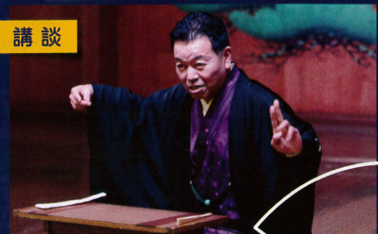
◎解説：大澤研一（大阪歴史博物館）