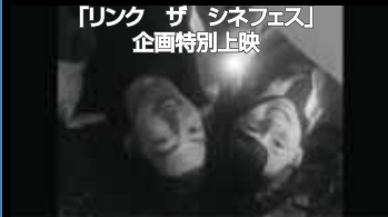
いいにおいのする映画 監督:酒井麻衣 (2015年/73分)