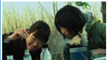
春を殺して 監督:森田和樹 (2016年/28分)