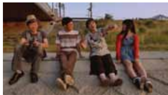
ライブハウスレクイエム 監督:松本卓也 (2015年/80分)