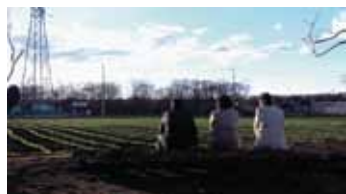
いもガール 監督:生見司織 (2017年/25分)

その他、DVDを購入できる「自主映画応援コーナー」や恒例の「映像体験アトラクション」も!