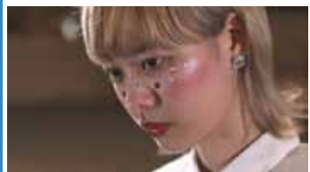
海へ行くつもりじゃなかった 監督:磯部鉄平 (2016年/35分)