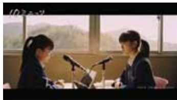
10ミニッツ 監督:長澤雅彦 (2016年/29分)