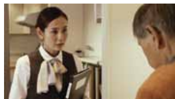
キッチン神様 監督:中根克 (2015年/29分)