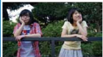
スリッパと真夏の月 監督:木場明義 (2015年/30分)