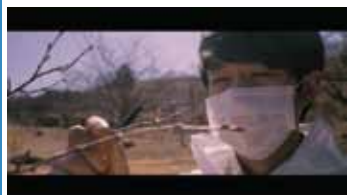
さくらになる 監督:大橋隆行 (2017年/79分)