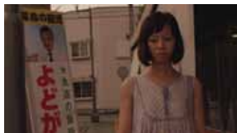
捨て看板娘 監督:川合元 (2014年/33分)