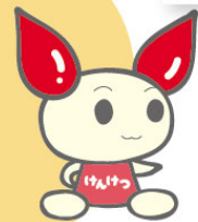
献血キャラクター けんけつちゃん