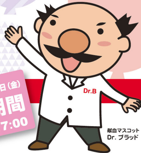
献血マスコット Dr. ブラッド