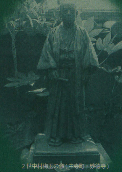
2世中村梅玉の像(中寺町・妙徳寺)