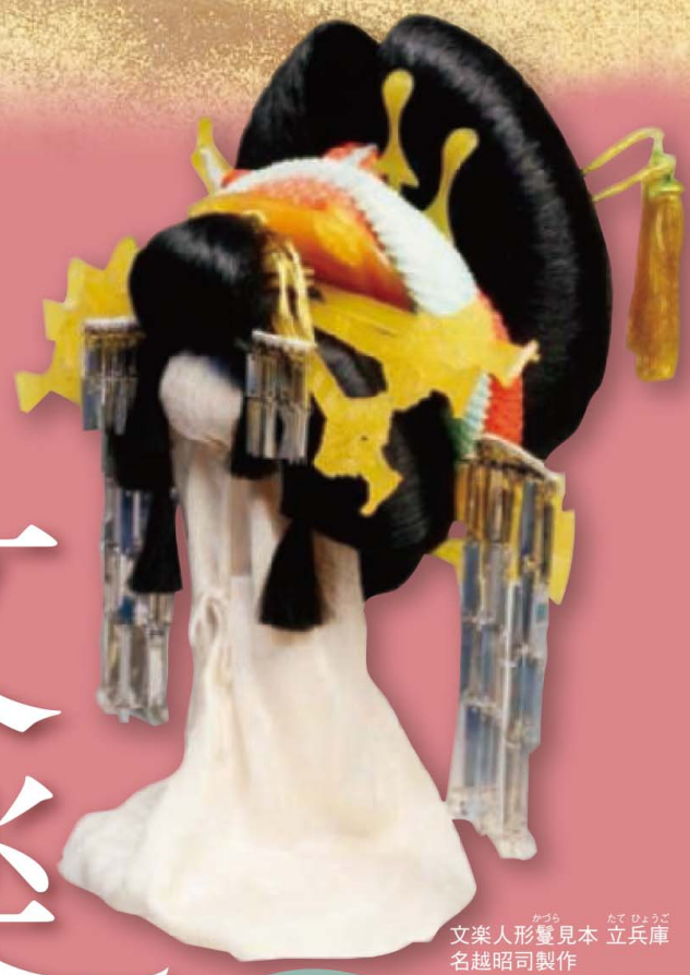
文楽人形髪見本 立兵庫 名越昭司製作 〔名越恵美子氏寄贈〕