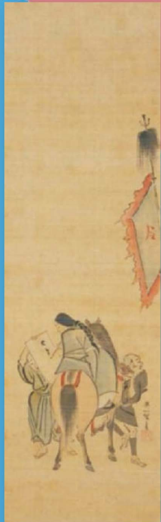
朝鮮通信使小童図 正徳度(1711年)〔辛基秀氏寄贈〕