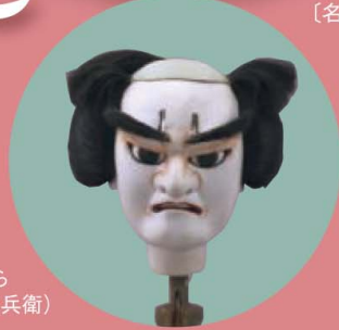
文楽人形かしら 文七(回七九郎兵衛)