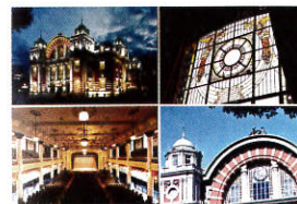
〈公会堂ポストカード〉