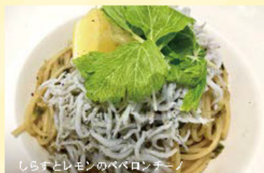
しらすとレモンのペペロンチーノ