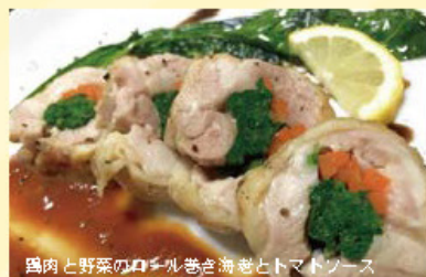
鶏肉と野菜のロール巻き海老とトマトソース