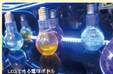
LEDで光る電球ボトル