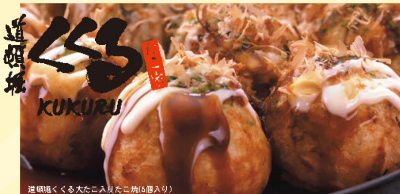
道頓堀くくる大たこ入りたこ焼(5個入り)