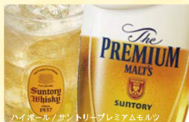
ハイボール / サントリープレミアムモルツ