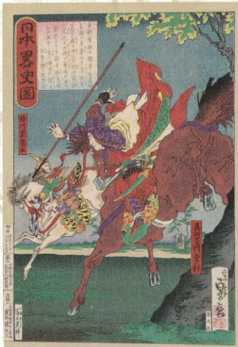
『日本略史図』真田左衛門幸村 (2代長谷川貞信)