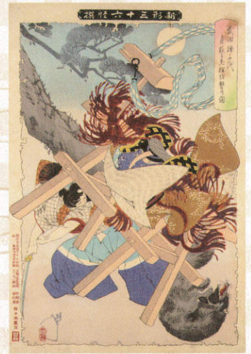
『新形三十六怪撰』武田勝千代、 月夜に老狸を撃つ図(月岡芳年)