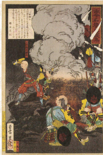
『古今名譽美談集』上杉輝虎謙信 (初代山崎年信)