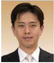
吉村洋文氏 大阪市長 Hirofumi Yoshimura

1998年 司法試験合格、2000年 弁護士登録、2011年4月 大阪市長議員当選、2014年12月 衆議院議員当選、2015年12月から第20代大阪市長。