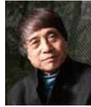
安藤忠雄氏 建築家 Tadao Ando

1941年大阪生まれ。独学で建築を学び、1969年安藤忠雄建築研究所設立。環境との関わりの中で新しい建築のあり方を提案し続けている。代表作に「光の教会」「大阪府立近つ飛鳥博物館」「淡路夢舞台」など、79年「住吉の長屋」で日本建築学会賞、95年プリツカー賞、03年文化功労者、10年文化勲章など受賞多数。イエール、コロンビア、ハーバード大学の客員教授歴任。97年から東京大学教授。現在、名誉教授、11年東日本大震災復興構想会議議長代理、「桃・柿育英会 東日本大震災遺児育英資金」実行委員長。