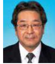
田中清剛氏 大阪市副市長 Seigou Tanaka

1961年(昭和36年)生まれ。東京大学大学院工学系研究科土木工学専門課程修了。86年建設省入省(現国土交通省)。国土交通省関東地方整備局道路部長、同省道路局道路交通管理課長、同省環境安全課長、同省大臣官房技術審議官を経て、2016年6月より現職。