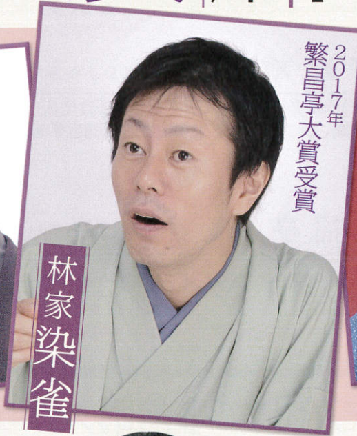
2017年 繁昌亭大賞受賞