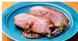
看板商品の合鴨コースを、特製みそに漬けて。上品な辛さです。 〈滋賀県 一湖房〉 合鴨の辛みそ仕込み(1袋) 2,484円