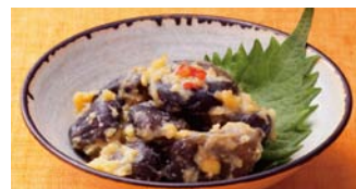
契約栽培の小茄子を使用し、京都独特の白味噌で漬けた雲母漬(きららづけ)。 〈京都府 雲母漬老舗〉 雲母漬(170g) 861円