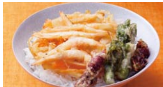
「富山湾の宝石」といわれる白えびを、かき揚げ天井に。 〈富山県 白えび亭〉白えびかき揚げ天井(1折) 801円