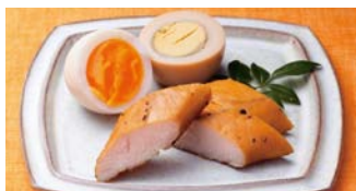
手作り燻製工房〈燻や〉自慢のおつまみセット。 〈佐賀県 燻や〉 おつまみセット(1セット) 540円