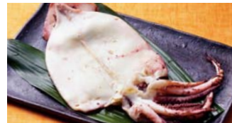
地元北浦のイカを一夜干しに。会場で焼いてご提供。 〈宮崎県 浜王水産〉 イカー一夜干し(1枚) 648円(各日30枚限り)