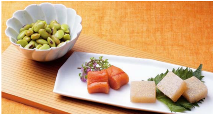
定番の肴、えだまめ・明太子・子持ち茱萸の燻製が3種。 〈大阪府 燻製BALPAL〉和の燻製三種(1セット) 1,296円

お持ち込みも、お持ち帰りも、お好みで。 各お店が手かけた肴を、日本酒とともにご堪能ください。