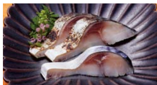
魚を知り尽くした〈竹長〉の目利きが選んだ鯖を使用。 〈京都府 竹長〉びさば・鯖あぶり(高島屋限定)(1枚) 各1,080円