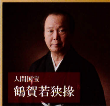
人間国宝 鶴賀若狭掾