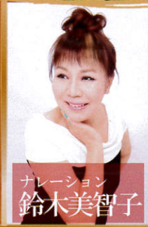
ナレーション 鈴木美智子