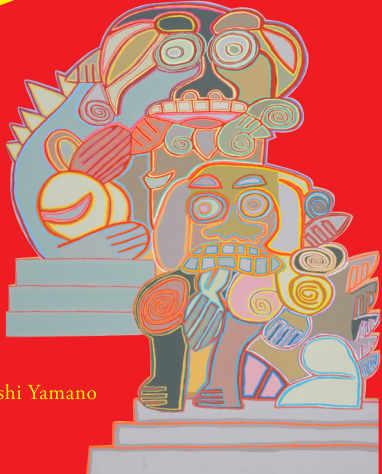
Art Work by Masashi Yamano

この晩秋、大阪・南船場の難波神社を舞台に、祝祭のアート、クラフトが集まります。 障がいのある人たちが生活のあらゆるところに美を見出す感覚は、わたしたちが古来から生活のなかに「やおよろずの神」を見出してきた感覚と重なります。日々をていねいに重ねながら生み出されたアート【エイブル・アート展】やものづくり、おおいなる自然の恵みから生まれた野菜など【やおよろずマルシェ】、日常を彩る文化【パフォーマンス・ワークショップ】を体験できます。ぜひご来場ください！